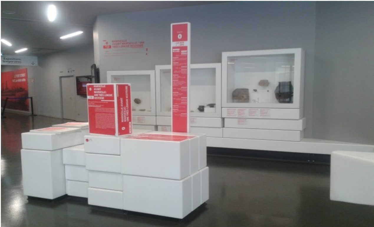
Vue de la séquence 0 , Musée d'Histoire de Marseille