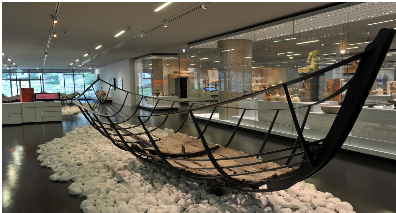
Vestiges de JV9 : Musée d'Histoire de Marseille, © photo W. Govaert