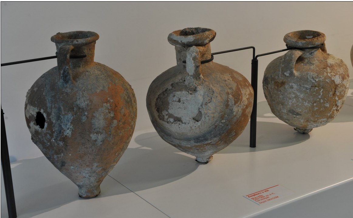
Amphores du VI ème av. JC, Musée d'Histoire de Marseille, © photo W. Govaert