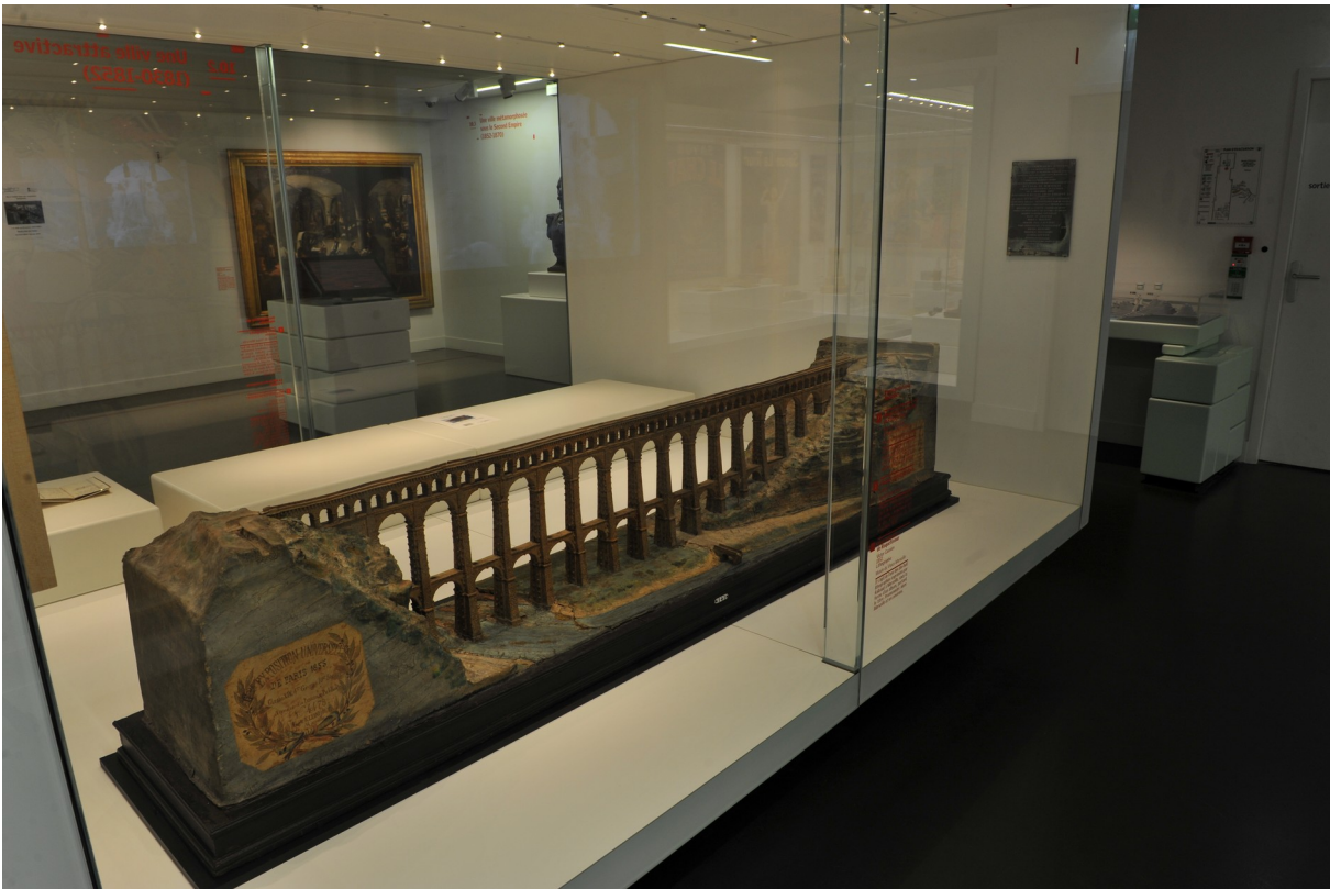
Maquette de l'aqueduc de Roquefavour, présentée à l'Exposition universelle de 1855, Musée d'Histoire de Marseille