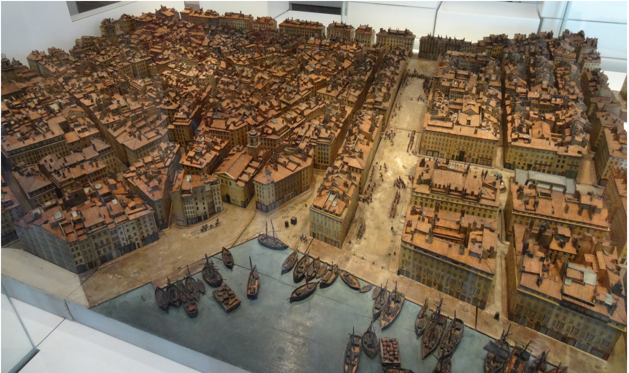
Plan-relief de Marseille, dit Plan Lavastre, 1848 – 1850, musée d'Histoire de Marseille