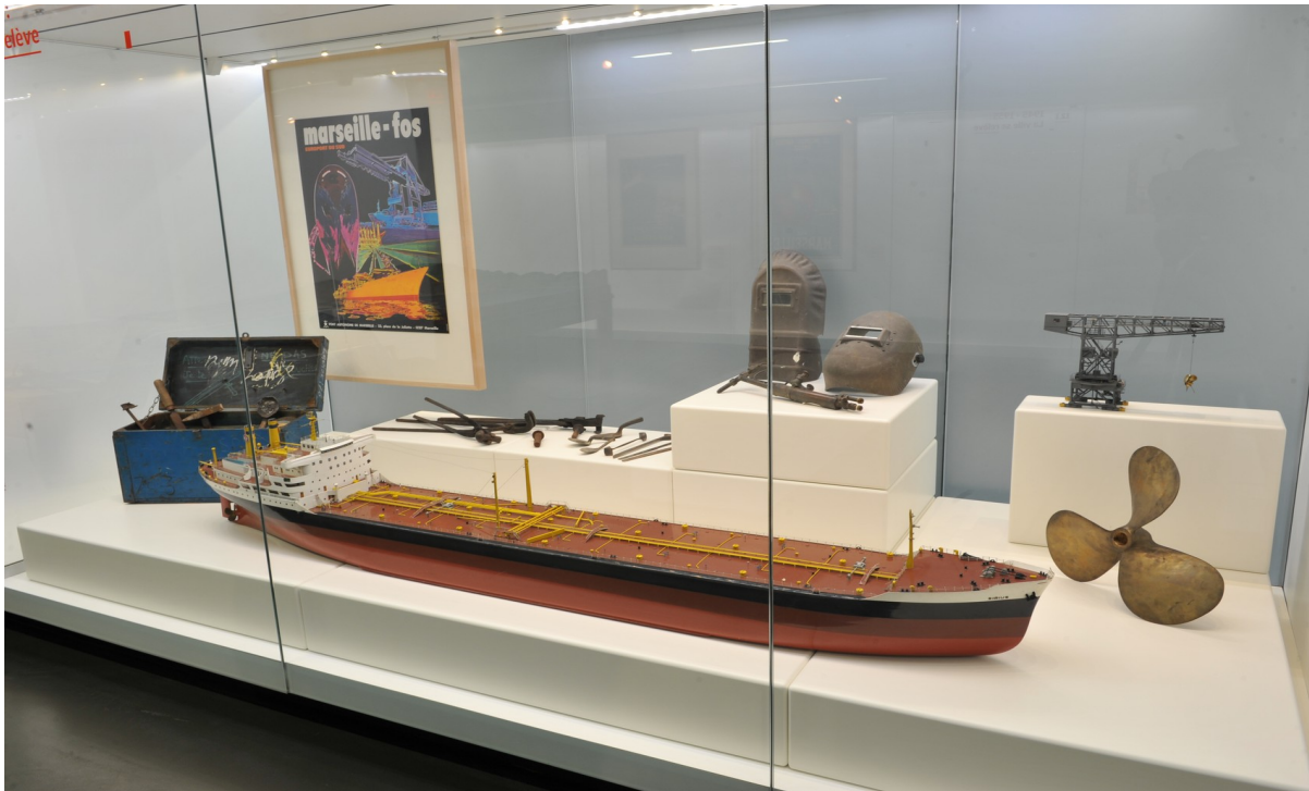
Maquette d'un pétrolier et objets issus de la réparation navale provenant du port de Marseille-Fos, musée d'Histoire de Marseille