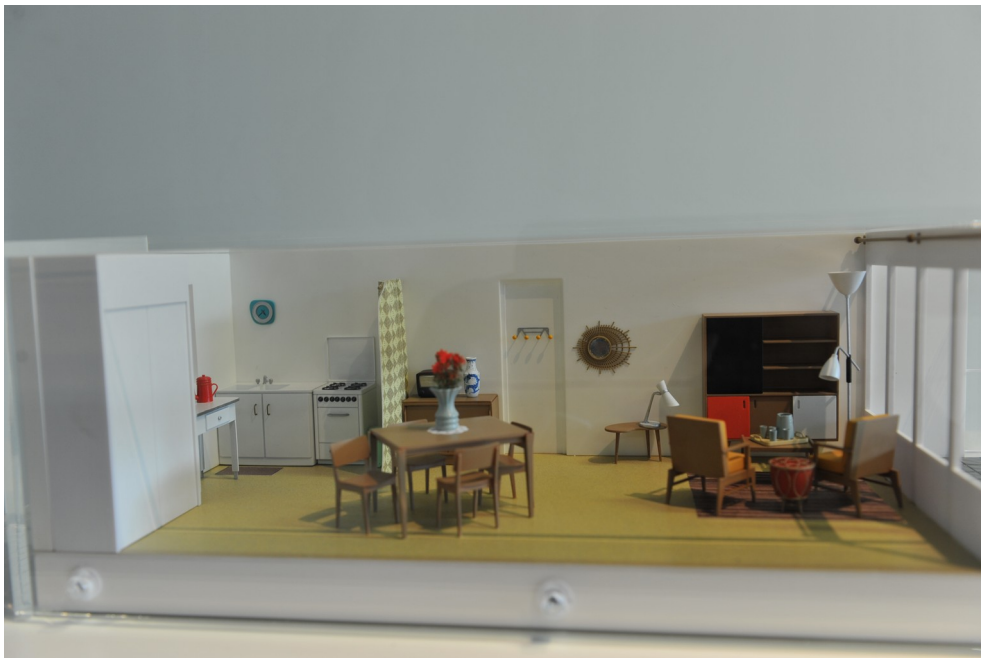
Maquette d'un intérieur marseillais type, musée d'Histoire de Marseille, © photo W. Govaert

- « Arts, théories et pratiques » : L'art, la doctrine et sa mise en pratique ; l'art et ses conventions ; l'art et les pratiques sociales