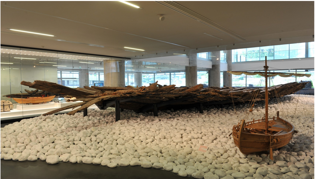
Le navire romain de la Bourse, fin du II ème siècle après J.-C., Musée d'Histoire de Marseille