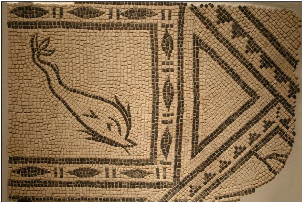
Panneau de mosaïques, musée d'Histoire de Marseille

Pas de lien direct avec les programmes pour cette séquence