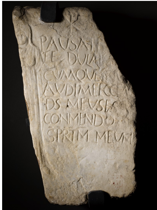
Épithaphe de Fedula, Musée d'Histoire de Marseille