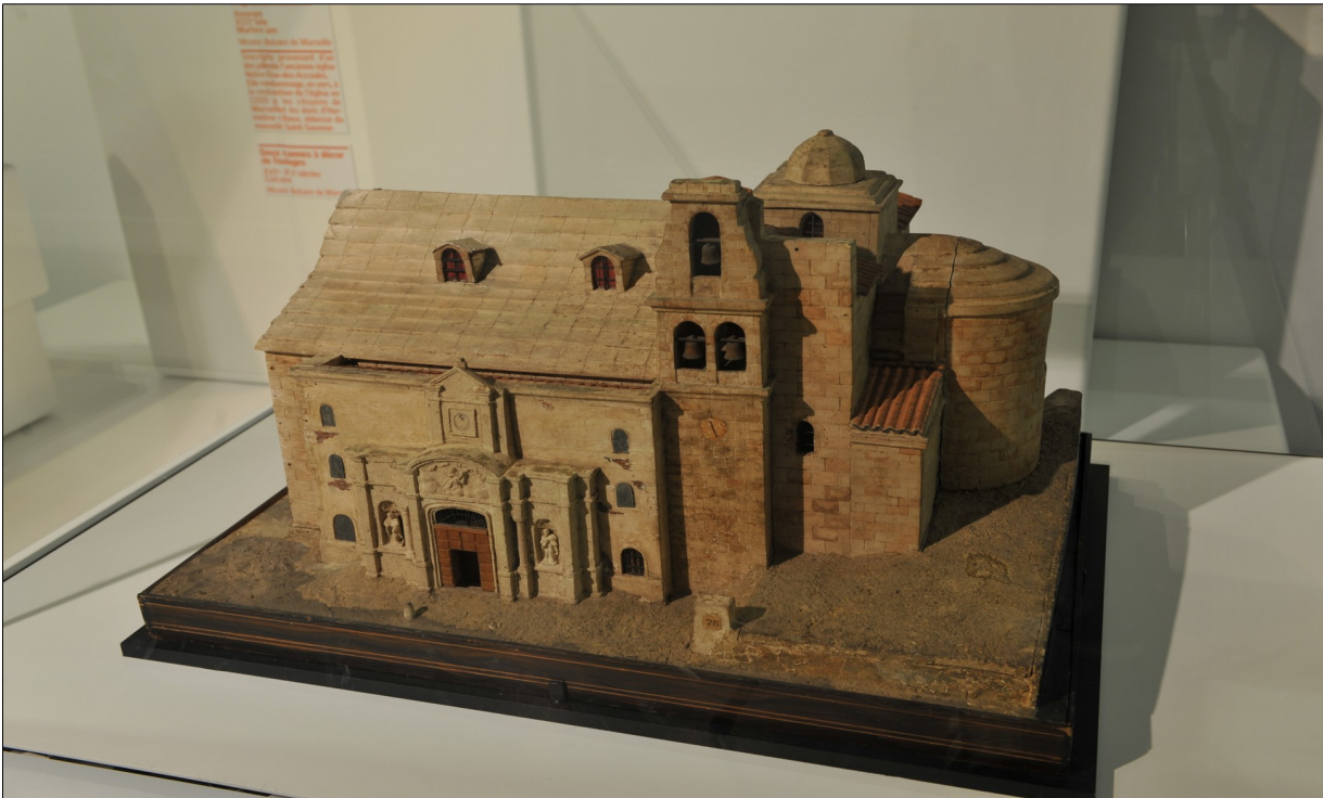
Maquette de la Vieille Major, Musée d'Histoire de Marseille