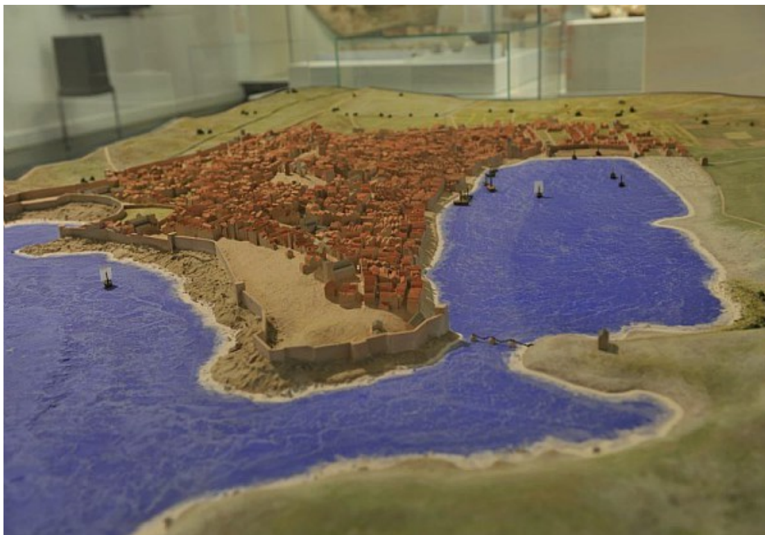
Maquette de Marseille au Moyen-Âge. Échelle 1/100e, Musée d'Histoire de Marseille, © photo W. Govaert