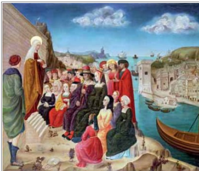
Prédication de Marie-Madeleine attribuée à Rontzen, huile sur bois, 70 x 84 cm, début du 16e siècle, Collection Musée de Cluny, dépôt au musée d'Histoire de Marseille