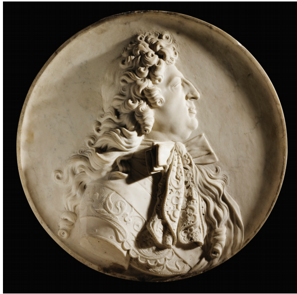
Portrait de Louis XIV, collection Musée des Beaux-Arts