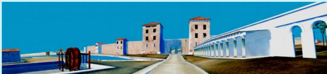
Évocation de l'entrée de la ville romaine, site archéologique du Port Antique,

Bonjour et bienvenue au musée d'Histoire de Marseille!