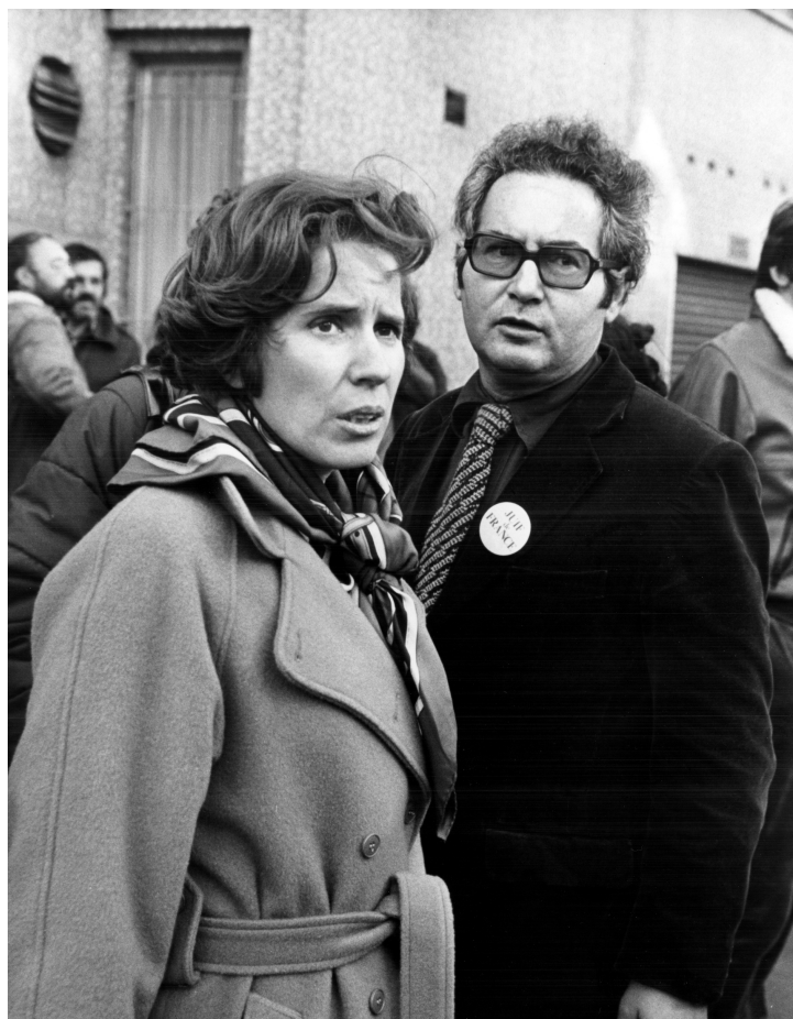
Crédit photo : Serge et Beate Klarsfeld lors de l'ouverture du procès de Cologne contre Lischka, Hagen et Heinrichsohn. Allemagne 23 octobre 1979. © Picture Alliance.

Entrée libre en salle d'exposition temporaire